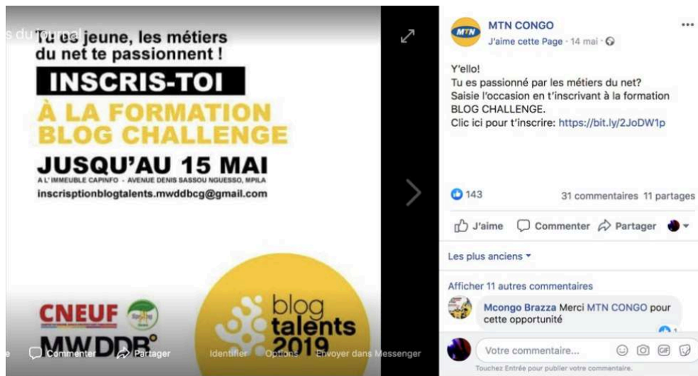
Image 3. Copie d'écran des pages Facebook de MTN