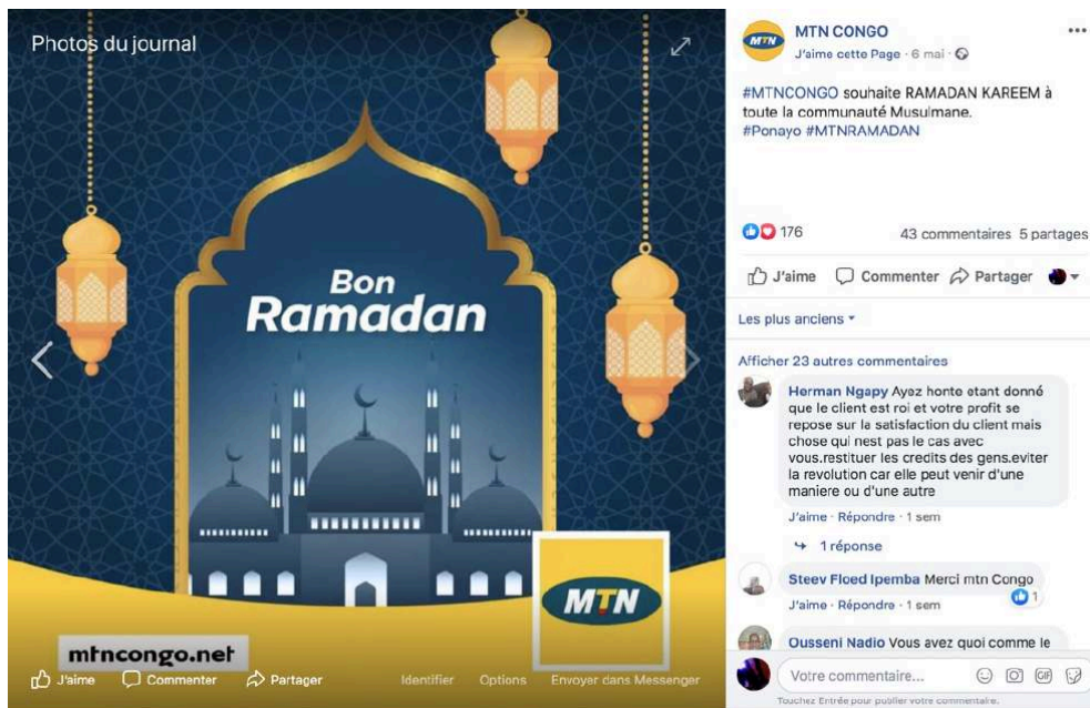
Image 6. Copie d'écran des pages Facebook de MTN