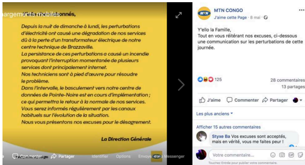
Image 1. Copie d'écran des pages Facebook de MTN

l'agencement de l'information construit par Facebook, il est identifié comme un premier commentaire avec comme particularité que ce premier commentaire est produit par le fournisseur de l'image de gauche, ce qui ne correspond pas aux pratiques habituelles sur Facebook et peut être analysé comme une manipulation des « abonnés » à cette liste MTN, même si MTN s'en protège en évoquant un processus de réitération des excuses intégrées dans l'image de gauche. MTN « aime cette page », c'est-à-dire sa propre page au risque d'y voir un excès d'investissement narcissique.