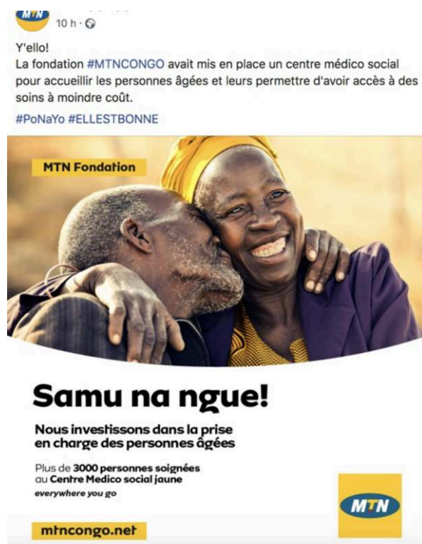
Image 2. Copie d'écran des pages Facebook de MTN

charge des personnes âgées ». MTN se dote d'une capacité opérationnelle à combler un manque des acteurs publics et privés au Congo, celui d'une prise en compte matérielle, financière et affective des personnes âgées. MTN se positionne alors comme acteur social pour combler un manque social et attendu quant à sa disparition par la population. MTN face à l'absence d'un Etat Providence, modèle extérieur au Congo, se positionne comme une société providence . Une véritable offre de service social est mentionnée en complément de ce qui peut être assimilé à un flyer. Le commentaire posté reprend une interpellation familière « Y'ello! » et le dièse de la modernité des réseaux avec la formule #MTNCONGO.