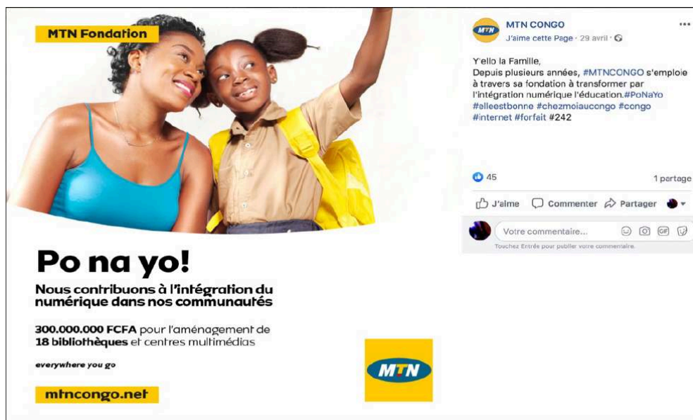
Image 4. Copie d'écran des pages Facebook de MTN