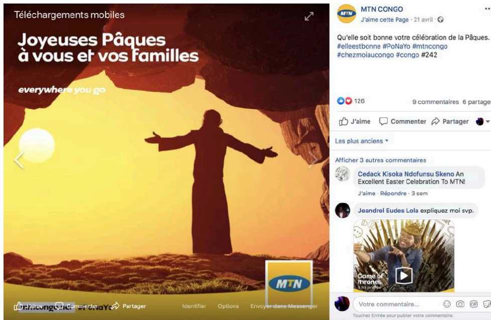
Image 7. Copie d'écran des pages Facebook de l'opérateur MTN