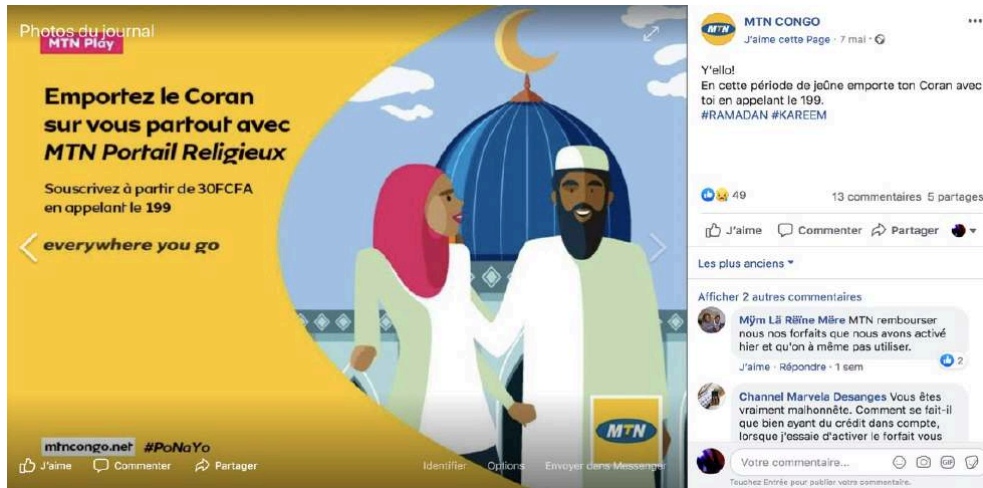
Image 5. Copie d'écran des pages Facebook de l'opérateur MTN

rapport à la photographie avec des signes linguistiques noirs sur fond jaune : « Emportez le Coran. Sur vous partout avec MTN Portail Religieux. Souscrivez à partir de 30FCFA » Il s'agit certes d'une offre de service qui s'adresse aux consommateurs musulmans de MTN, avec la représentation d'un couple hétérosexuel de musulmans souriants aux corps en contact tactile de manière réciproque.